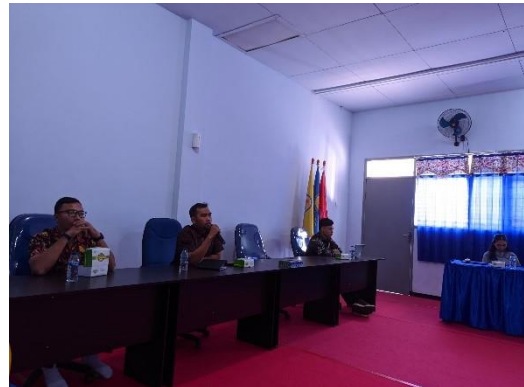
Foto 4. Pemaparan Sosialisasi Roadmap