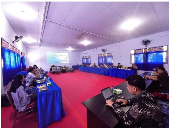
Foto 3. Dosen dan Pimpinan Universitas