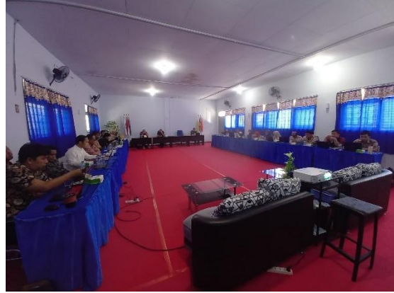
Foto 2. Sosialisasi Roadmap Penelitian