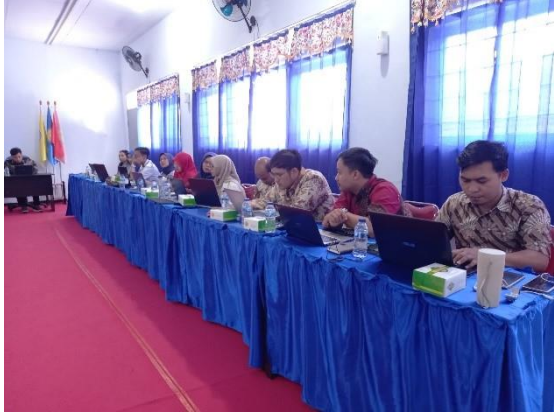
Foto 1. Sosialisasi Roadmap Penelitian